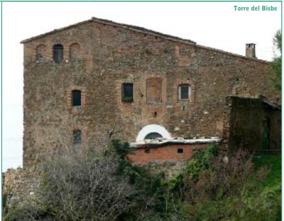
Torre del Bisbe

Aquest petit monestir, de 1237, està situat a la vessant sud-oest de la part de la serralada de Collserola que dona a la vall de Sant Feliu de Llobregat i dintre del districte de Sarrià-Sant Gervasi.